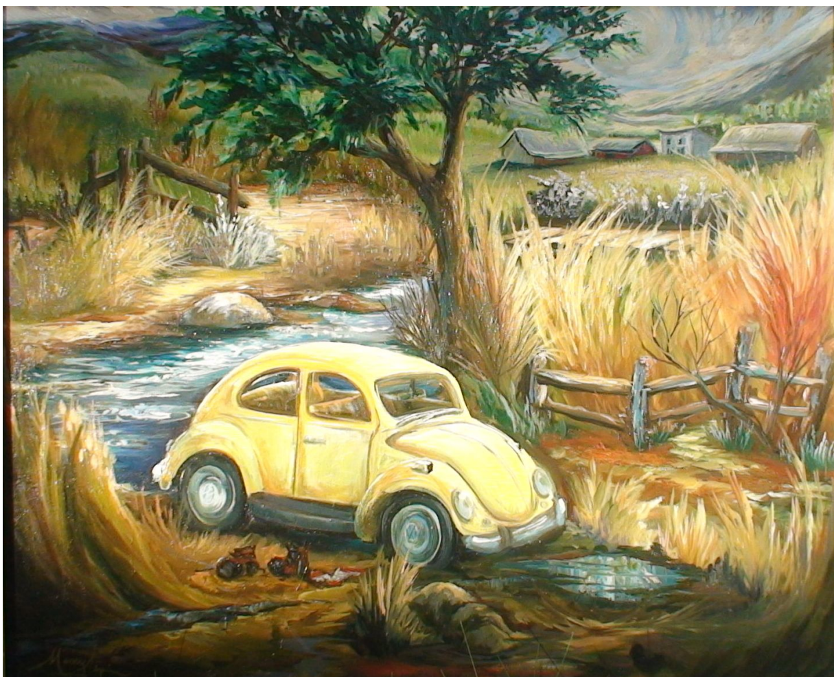
Photo : huile sur toile de Nancy Lépine, peintre et animatrice du cours de peinture acrylique et à l'huile

Le Conseil souhaite que vous conserviez et consultiez ce bulletin jusqu'au prochain. C'est le meilleur instrument de communication du secteur, le moyen le plus sûr de connaître les activités et les événements spéciaux du 10 J. C'est la vie du secteur Laval-Nord qui vous est racontée.